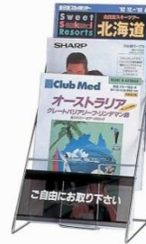
卓上カタログスタンド