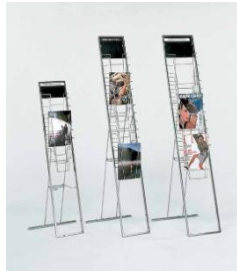
カタログスタンド