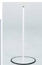
ポールパーテーション